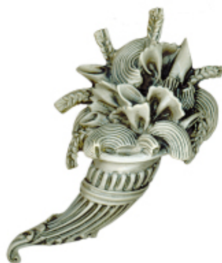
Realizzata da Mario Buccellati per il Museo