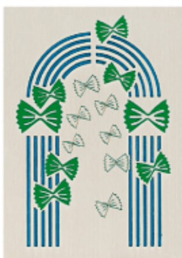
Realizzato da Sergio Ansuini per il Museo