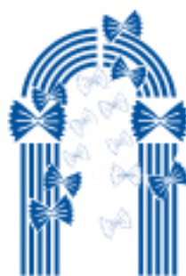
Realizzato da Mario Cordeglio per il Museo